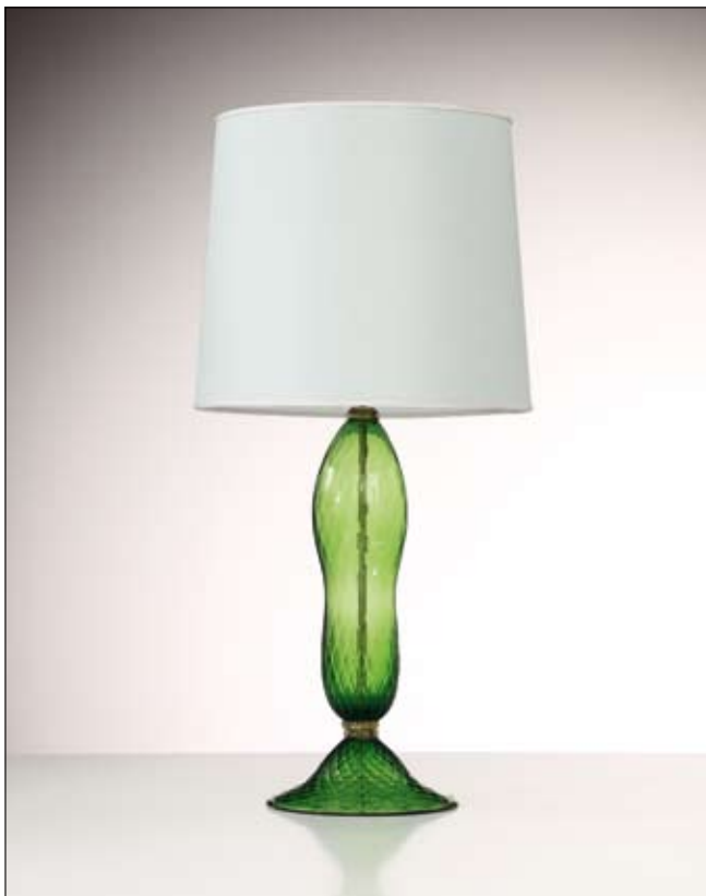
Mod: GB 15 - h 50 cm - Ø base 23 cm