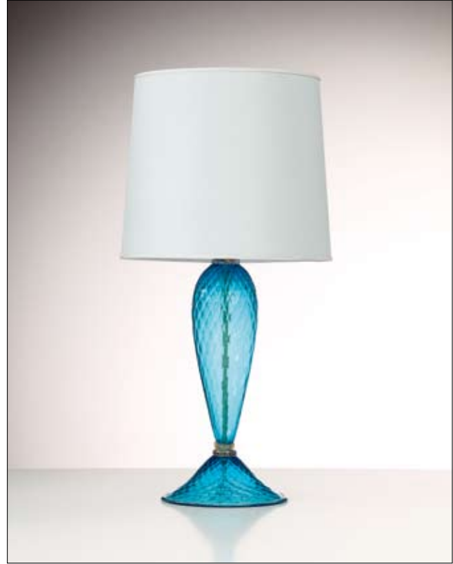
Mod: GB 18 - h 50 cm - Ø base 23 cm