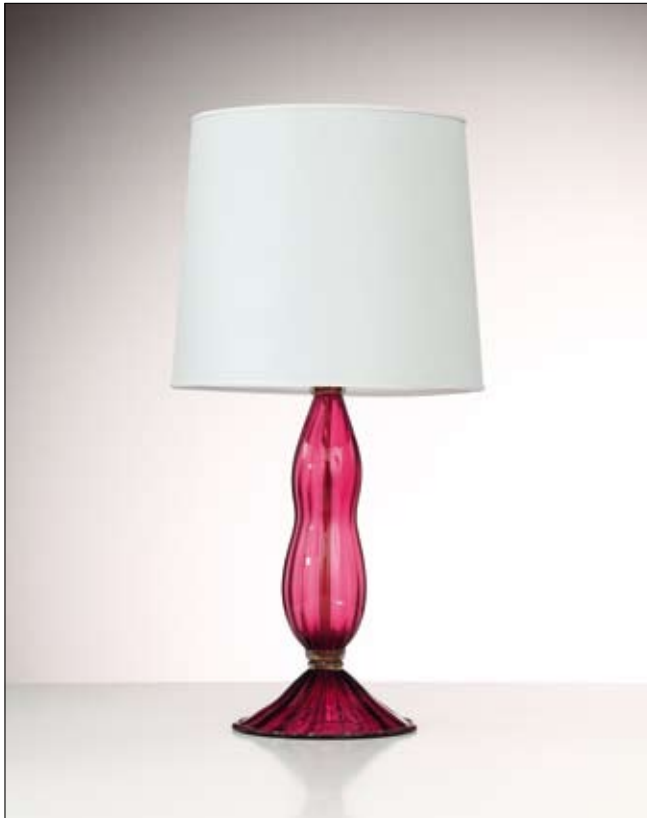
Mod: GR 21 - h 50 cm - Ø base 23 cm

Le dimensioni riportate si riferiscono alla lampada senza paralume. Paralume non incluso. | The quoted dimensions refer to the lamp without lampshade. Lampshade not included.