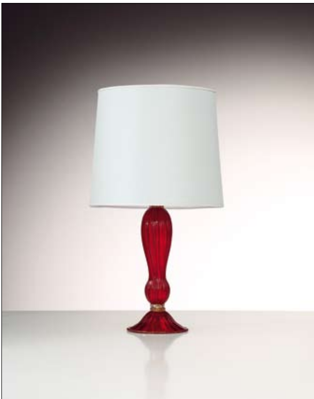
Mod: PR 11 - h 35 cm - Ø base 20 cm