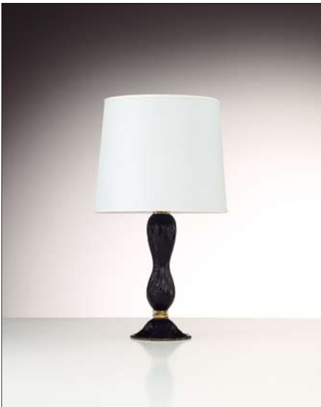
Mod: PB 03 - h 35 cm - Ø base 20 cm