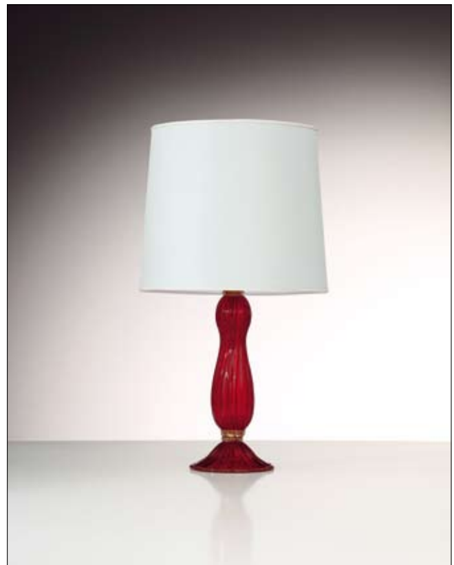
Mod: PR 12 - h 35 cm - Ø base 20 cm