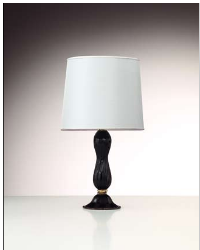
Mod: PR 08 - h 35 cm - Ø base 20 cm