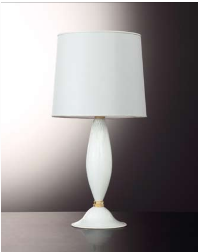
Mod: GB 19 - h 50 cm - Ø base 23 cm