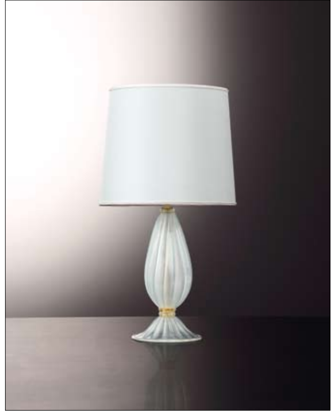
Mod: PR 10 - h 35 cm - Ø base 20 cm