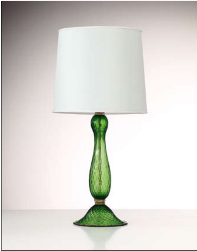
Mod: GB 13 - h 50 cm - Ø base 23 cm

Le dimensioni riportate si riferiscono alla lampada senza paralume. Paralume non incluso. | The quoted dimensions refer to the lamp without lampshade. Lampshade not included.