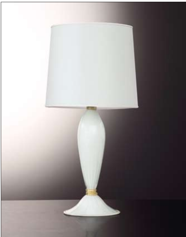
Mod: GR 26 - h 50 cm - Ø base 23 cm