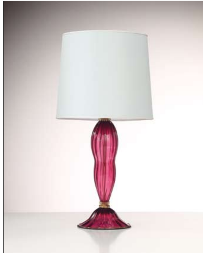
Mod: GR 22 - h 50 cm - Ø base 23 cm