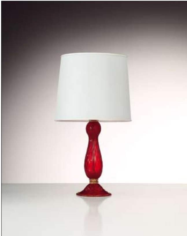
Mod: PB 05 - h 35 cm - Ø base 20 cm

Le dimensioni riportate si riferiscono alla lampada senza paralume. Paralume non incluso. | The quoted dimensions refer to the lamp without lampshade. Lampshade not included.