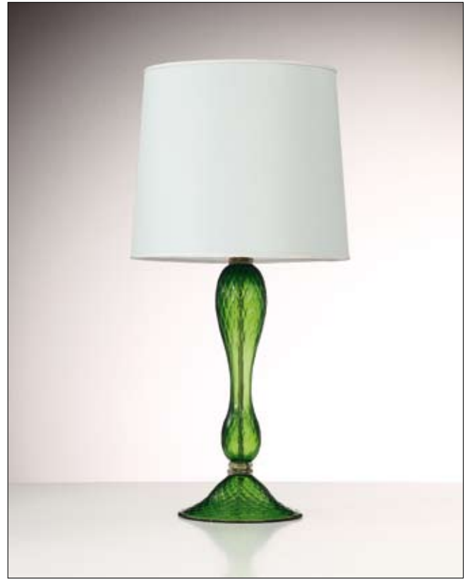
Mod: GB 14 - h 50 cm - Ø base 23 cm