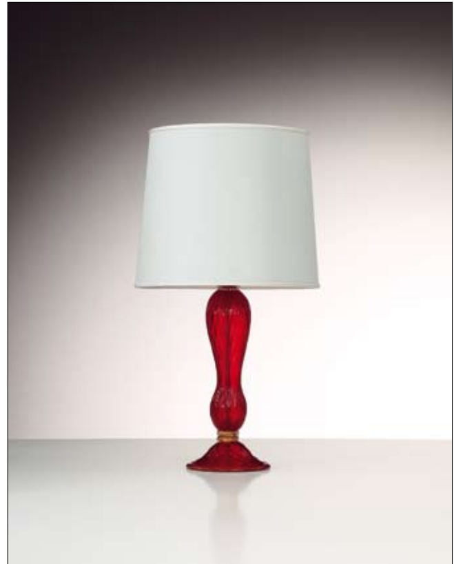
Mod: PB 06 - h 35 cm - Ø base 20 cm