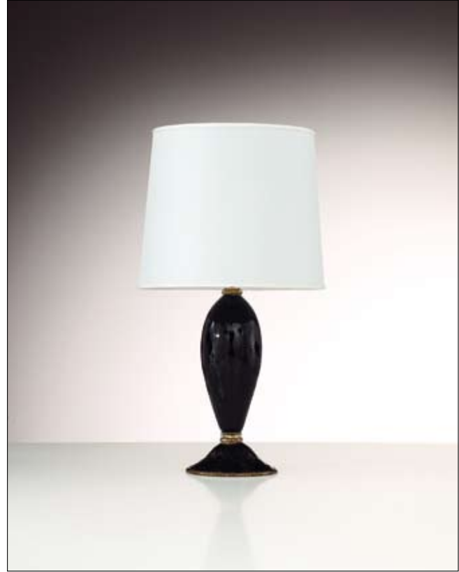
Mod: PB 02 - h 35 cm - Ø base 20 cm