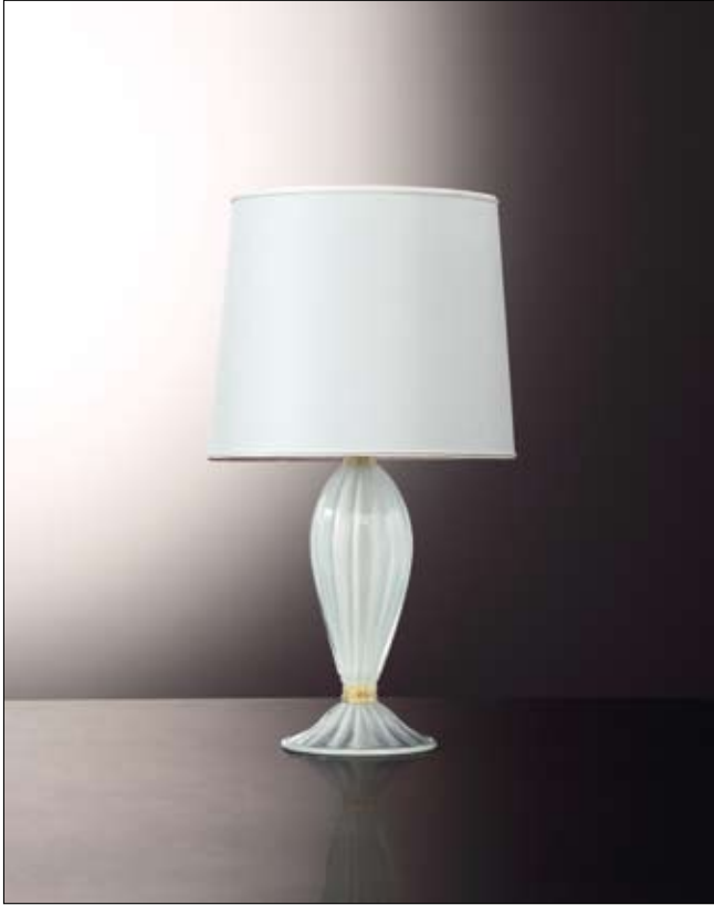
Mod: PR 09 - h 35 cm - Ø base 20 cm