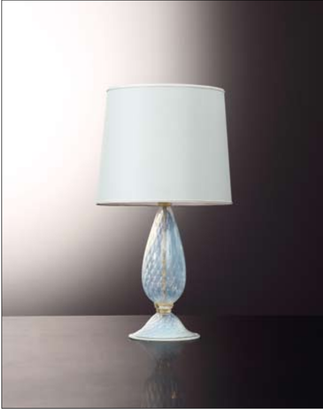
Mod: PB 01 - h 35 cm - Ø base 20 cm