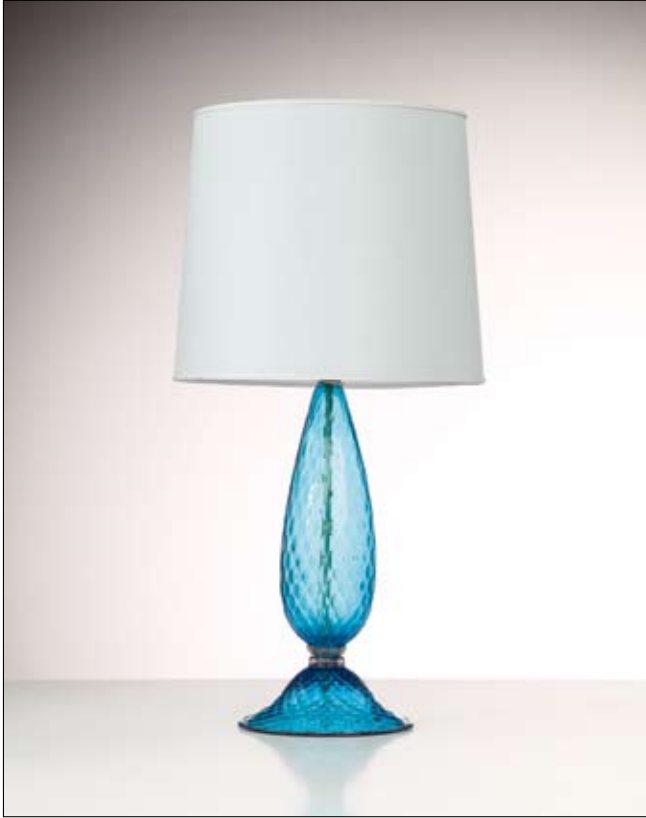
Mod: GB 17 - h 50 cm - Ø base 23 cm