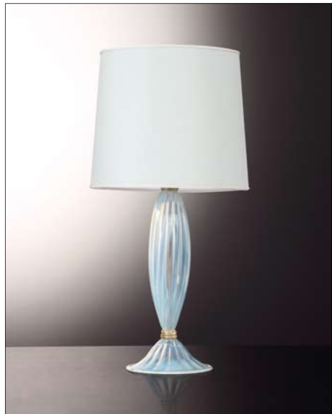
Mod: GR 20 - h 50 cm - Ø base 23 cm