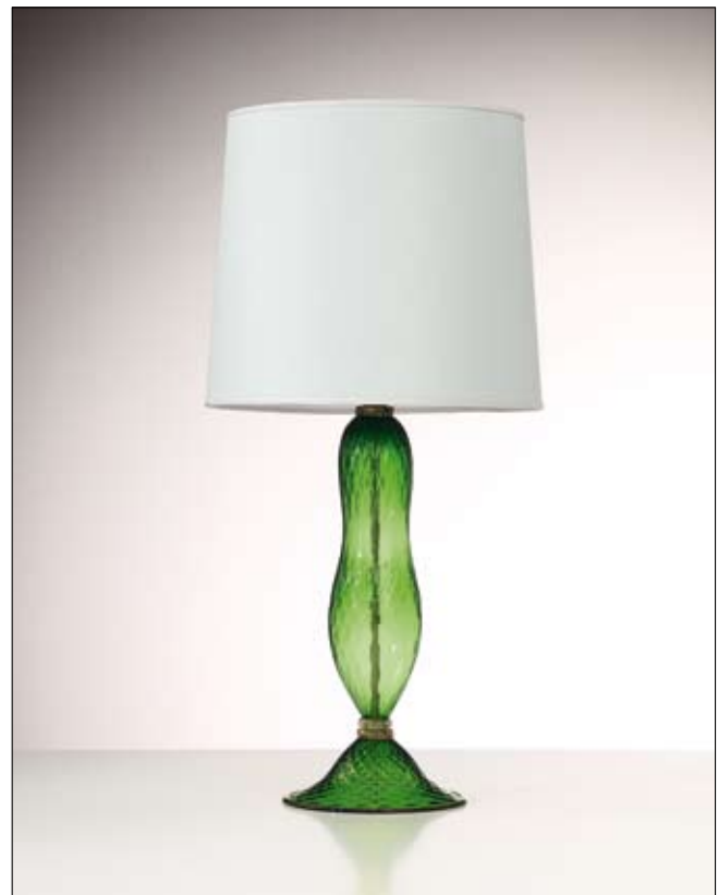
Mod: GB 16 - h 50 cm - Ø base 23 cm