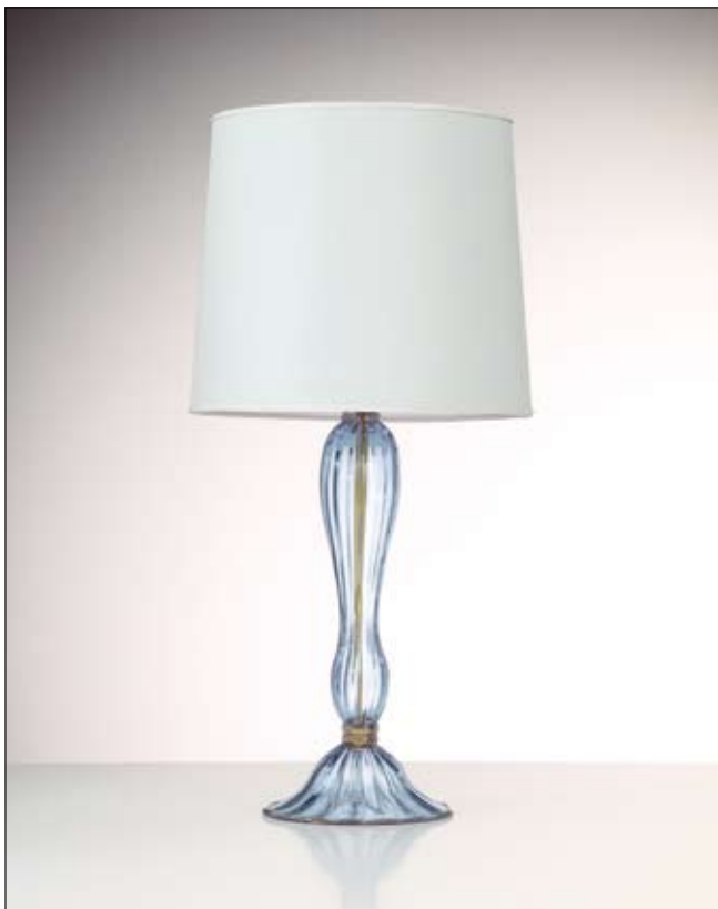
Mod: GR 23 - h 50 cm - Ø base 23 cm